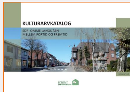
2013 Kulturarvkatalog Beskrivelse af byens historie, kulturarv og særlige identitet samt forslag til projekter