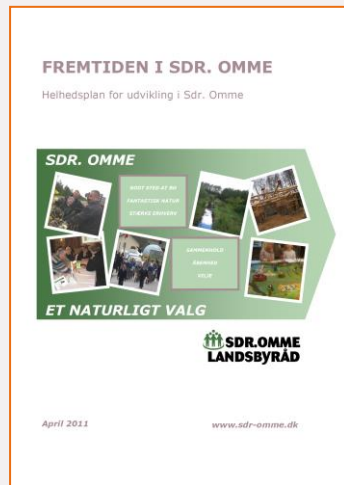
2011 Helhedsplan Mål for byens udvikling Fysisk, socialt, kulturelt

Vi bygger stadig videre på fundamentet fra Helhedsplanen 2011