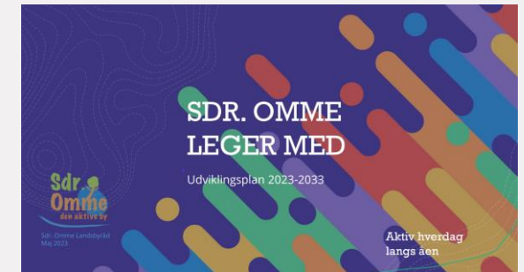
2023 Udviklingsplan Mål for næste 10-årige periode Mere af det vi allerede kan og gør for at bevare vores mennesker, serviceniveau og en god by alt leve i.