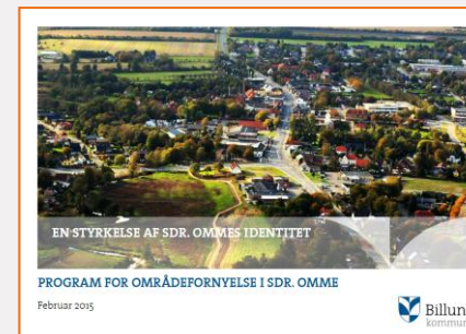
2015 Områdefornyelsesplan Program for projekterne: Sigeng, Åstederne og trafikforbedringer