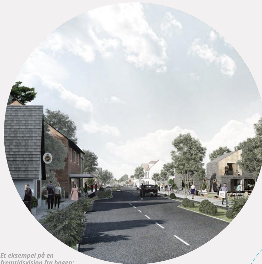
Et eksempel på en fremtidsvision fra bogen: "De historiske stationsbymidter som kulturarv" Realdania

Vi drømmer om, at vi i løbet af det næste årti, sammen med Billund Kommune, kan tage hul på trafikdæmpning, sanering/ nedrivning/ udskiftning af forfaldne ejendomme og en mere grøn udvikling